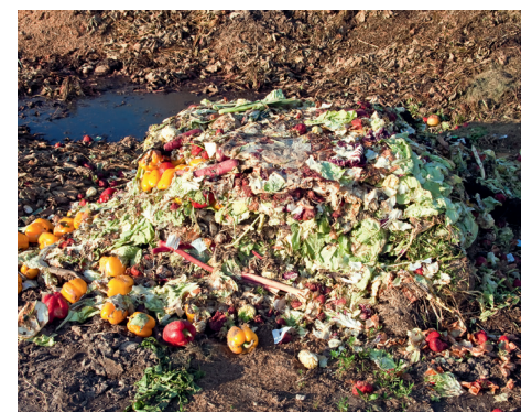
Food Waste ist ein grosses Problem. In NW-Europa entstehen den Händlern Umsatzverluste von rund 56 Milliarden Franken.